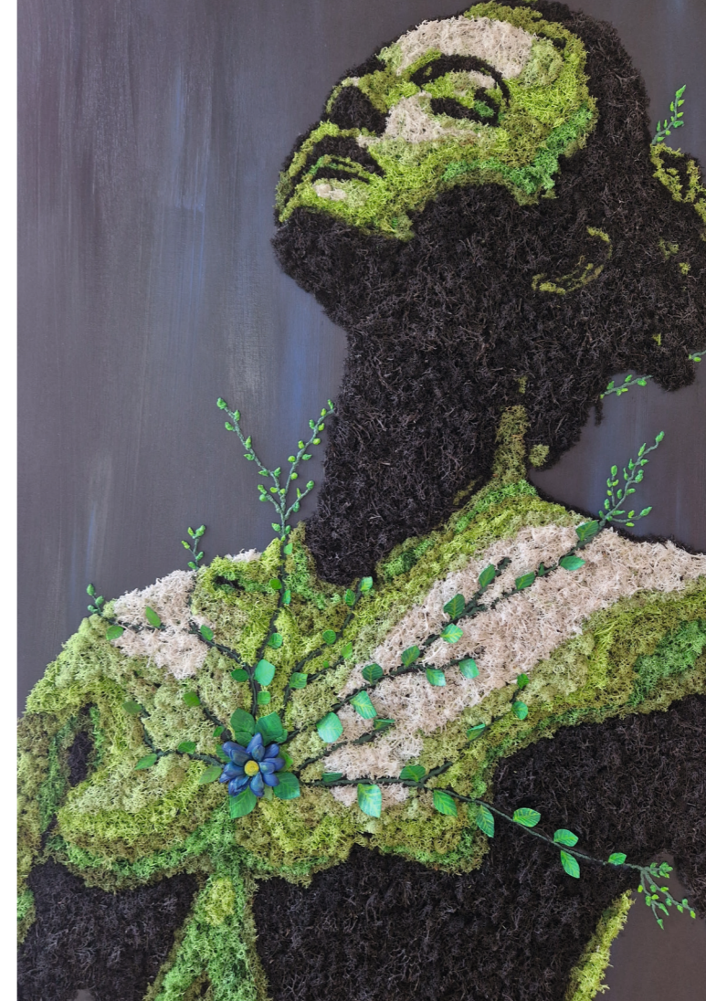
„Erwachen“ © Johanna Lehmeier

Anmeldeschluss: 14 Tage vor Veranstaltungsbeginn